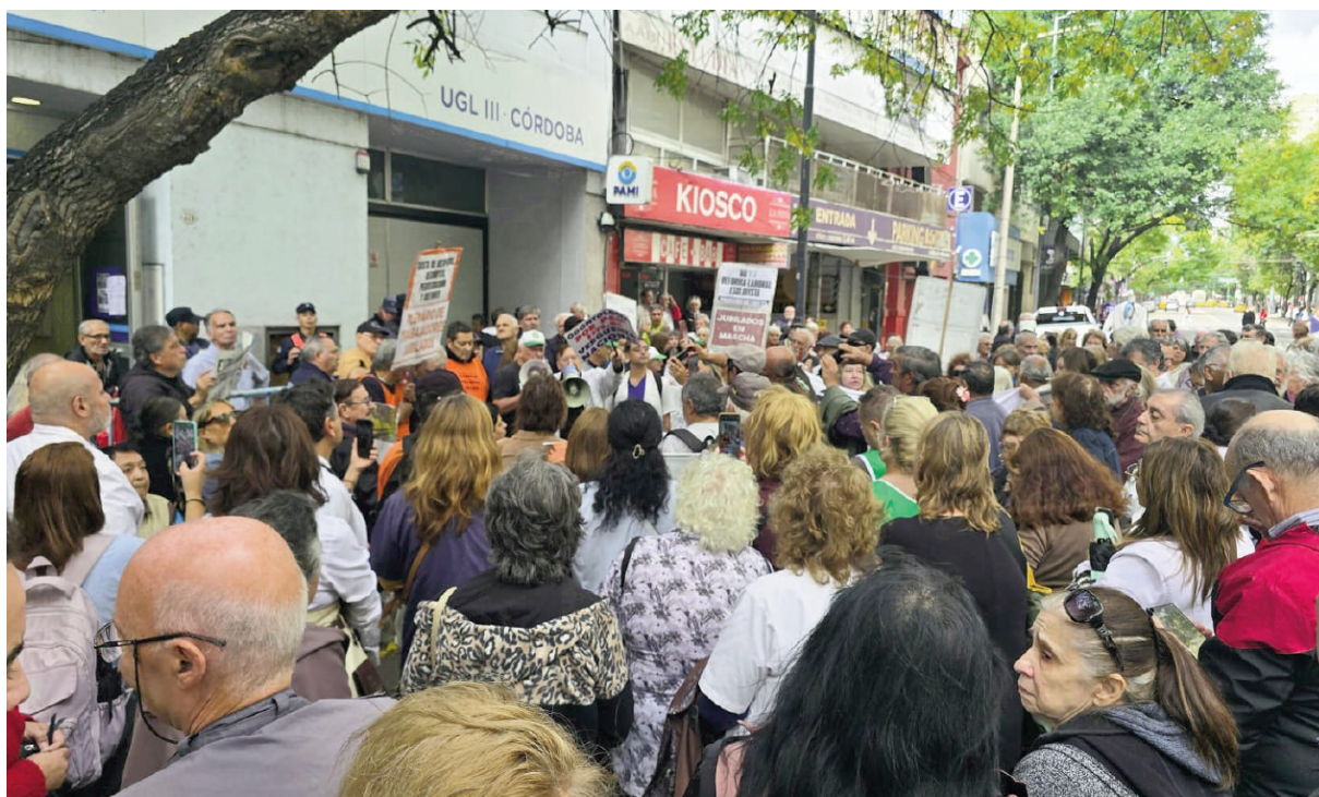
Córdoba: marcha en solidaridad con los médicos del PAMI.