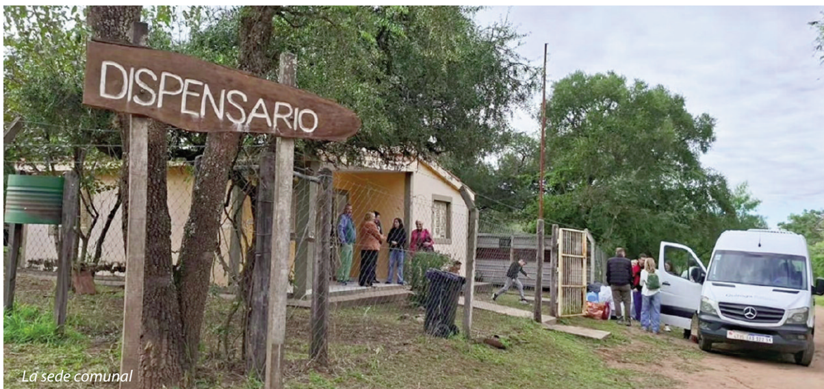
La sede comunal

Los resultados fueron destacados como satisfactorios por los integrantes del grupo, teniendo en cuenta que la población es de 350 habitantes.